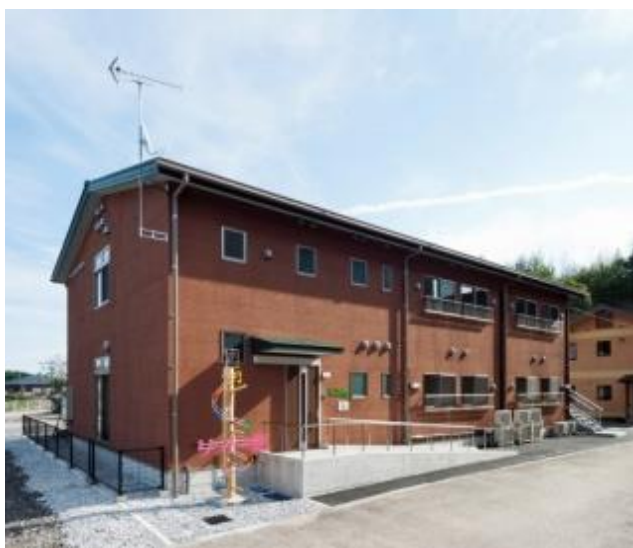
グループホーム全景