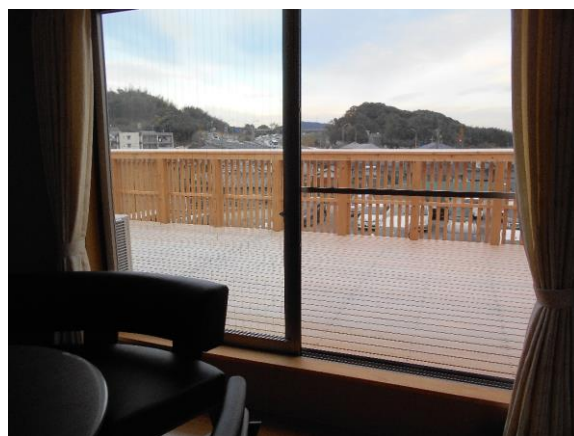
2階 居間から見たバルコニー