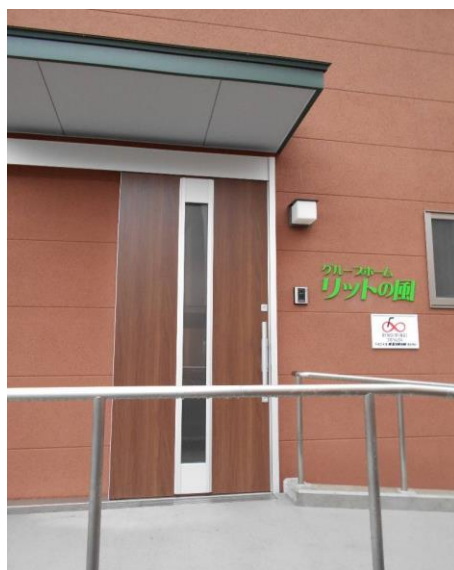
玄関（補助事業標示）